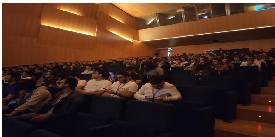
Figura: Congreso XXX CEET de Pamplona

Las empresas patrocinadoras también tendrán un lugar destacado durante la Cena de Gala del Congreso CEET, que tendrá lugar el día 19 de septiembre, al finalizar la jornada de puertas abiertas del congreso.